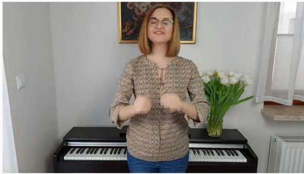
Piosenka o wiosnie z pokazywaniem "To już czas" z Audiozabawy "Wiosennej"

https://www.youtube.com/watch?v=jd4kpSAWg4g