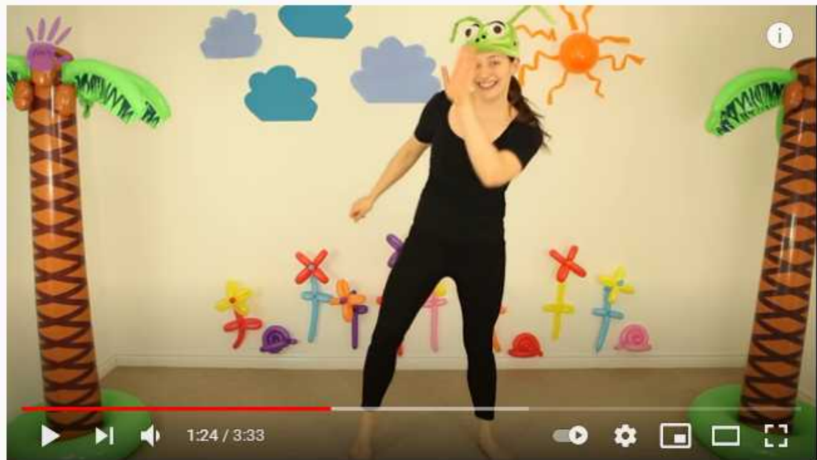
Zabawa - Na ziemi zostaje

https://www.youtube.com/watch?v=S5TFdKc6TB4